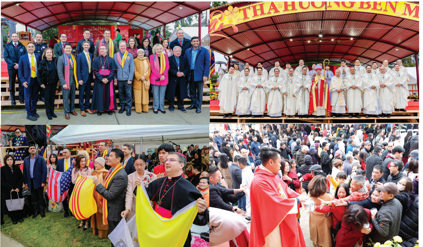
Hình ảnh trong Thánh Lễ Mừng Tết Ất Ty tại Hội Chợ Tết - thứ Bảy 1/02/25

Xin theo dõi các sinh hoạt của GX trên trang Facebook của GX Đức Mẹ La Vang Việt Nam San Jose https://www.facebook.com/OurLadyofLaVangParishSanJose