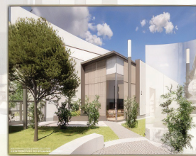
Công Ty Kiến Trúc SIM Architects, Inc.