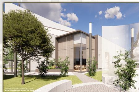
Công Ty Kiến Trúc SIM Architects, Inc.